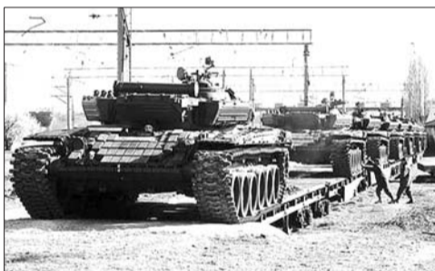
俄军坦克运抵克里米亚。

本报讯 《简氏防务周刊》报道称,俄罗斯一支陆军装甲部队日前已经开赴克里米亚,该部队配备有多辆主战坦克,包括30多辆T-72坦克。这一增加部署的举动使乌克兰东部局势更加紧张。报道称,这批坦克从俄罗斯本土经由刻赤的滚装铁路轮渡码头,运至克里米亚半岛后,由两列军用列车运至克里米亚Gvardeyskoe村的空军和后勤基地。这条路线现已成为俄罗斯军队运输装备和货物的主要转运点。据悉,俄军在克里米亚的行动一直依靠轮式装甲车。此次部署被认为是俄罗斯进一步强化克里米亚军事力量的行动,以防止乌克兰试图夺回该半岛。预计这支部队要一直转移到俄乌在克里米亚北部的边界,为俄罗斯的攻守争取更大的选择余地。目前为止部署在这一地区的部队均配备先进的BTR-80轮式装甲运兵车,装有122毫米和152毫米牵引火炮。这样一来,作为行动先锋的俄空降部队和海军步兵部队就可以撤离克里米亚并着手筹备新的行动。此外,俄罗斯还在空军基地停机坪的北部部署了“S-300”防空导弹,并装配雷达系统监测北方区域,防止乌克兰空袭该空军基地。(宗禾)