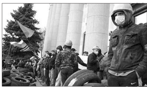
7日,哈尔科夫市政府大楼外的亲俄示威者。