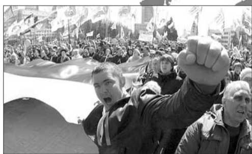
7日,亲俄示威者在顿涅茨克市政府大楼前集会。

数千名亲俄民众6日在乌克兰东部邻近俄乌边境的顿涅茨克、卢甘斯克和哈尔科夫3座主要城市举行抗议活动。一些民众占领了当地政府办公大楼,或挥舞、或升起俄罗斯国旗。乌克兰政府和西方国家担心,俄罗斯或借口保护俄罗斯族人入侵乌东部地区。