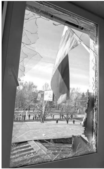
7日,卢甘斯克市一栋建筑被损坏的窗户外悬挂着一面俄罗斯国旗。

如派遣部队进入乌克兰。”但对于西方有关俄罗斯陈兵边境地区的说法,俄罗斯外长拉夫罗夫本月早些时候说,乌克兰和西方国家不该炒作俄在边境地区举行的军事演习,应理性对待相关事态。拉夫罗夫说,俄武装力量在本国领土的军事调动不存在任何法律问题。在他看来,一些人严重脱离实际情况,对俄方的演习过度炒作。综合新华社、中新网等消息