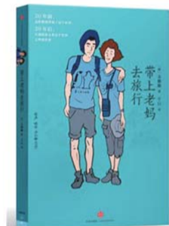
《带上老妈去旅行》 作者:(韩) 太源俊 译者:千日 出版社:中信出版社

本书为美国外交官谢伟思的传记。他亲历了20世纪40年代中美关系的转折,并在其中发挥了非同寻常的作用。他随美军观察组访问延安达3个月,并作为其中唯一的外交官员,与毛泽东、周恩来、朱德等多次长谈。本书通过谢伟思的一生,展现了美国对华政策的曲折变化。其中的细节和时代的氛围非身处其中者是无法感受到的。