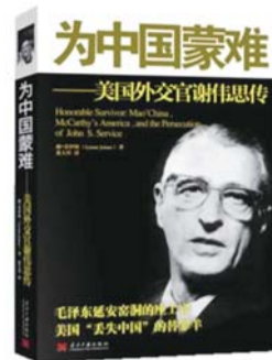
《为中国蒙难》 作者:(美)琳 乔伊纳 译者:张大川 出版社:当代中国出版社

本书为美国外交官谢伟思的传记。他亲历了20世纪40年代中美关系的转折,并在其中发挥了非同寻常的作用。他随美军观察组访问延安达3个月,并作为其中唯一的外交官员,与毛泽东、周恩来、朱德等多次长谈。本书通过谢伟思的一生,展现了美国对华政策的曲折变化。其中的细节和时代的氛围非身处其中者是无法感受到的。