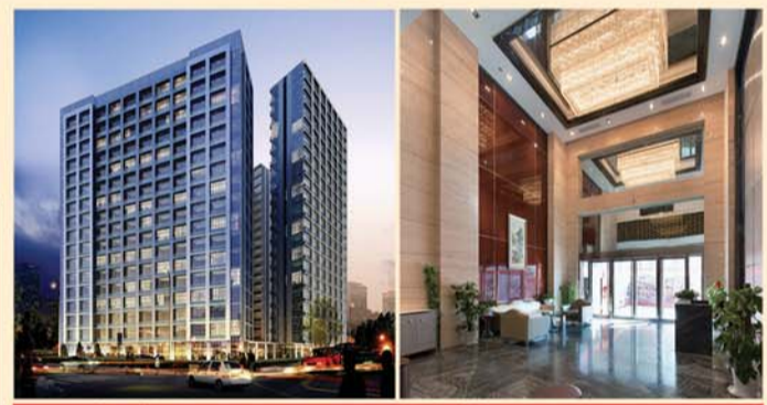
▶ 项目夜景效果图 ▶ 大堂实景图