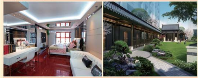
▶ 样板间实景图 ▶ 屋顶花园效果图