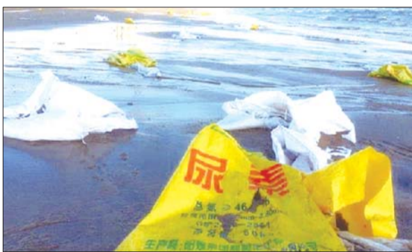
第一海水浴场沙滩上漂来的编织袋上写有“尿素”字样。

工作人员说,这次这些编织袋可能是从港务局方向漂过来的,“估计原来沉在海底,风浪大的时候就涌过来了”。据工作人员介绍,今年