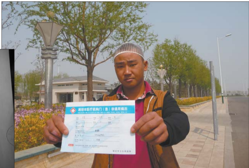
▲施工队一人被打头部缝了七八针。