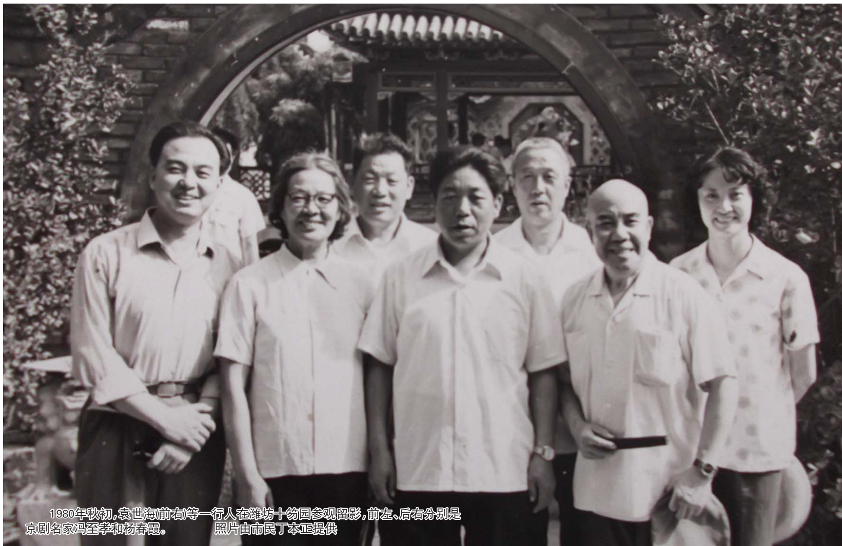
1980年秋初,袁世海(前右)等一行人在潍坊十笏园参观留影,前左、后右分别是京剧名家冯至孝和杨春霞。