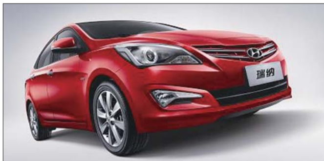
▶北京现代瑞纳近照。

3月17日,北京现代新瑞纳正式上市销售,全系共9款车型,提供7种车身颜色和米色、灰色两种内饰颜色,售价区间维持不变。同天,北京现代倾力打造“品位不凡的动感掀背车”——瑞奕也宣布正式上市。为了回馈广大消费者,北京现代莒县和瑞4S店将携新瑞纳、瑞奕登场本报“齐鲁晚报莒县春季车展”。