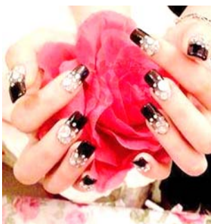
北欧美甲原价 30 元美甲套餐持本报仅需 9.9 元。