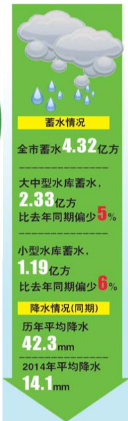
(据市防汛抗旱指挥部提供数据制图)

为应对旱情,泰安市14座大中型水库、塘坝已陆续开闸放水,如果旱情进一步加剧,泰安市将启动抗旱应急预案,采取加大引水、合理调配水源、应急打井、采取节水灌溉等抗旱应急措施,并在抓好应急措施的基础上,规划和实施中长期抗旱措施。