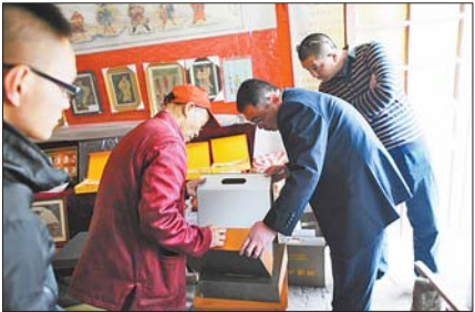
▲几名年轻人慕名前来购买彩绘艺术作品。