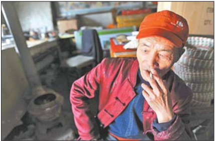
▲无人愿接衣钵,这让老侯很窝心。 ◀平日,老侯一直猫在简陋的工作室里潜心创作。