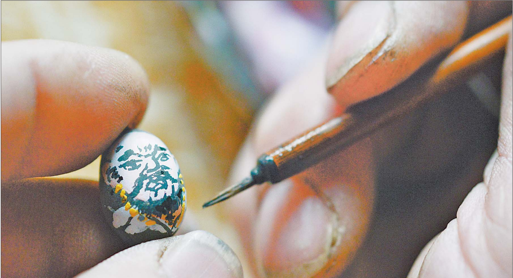
▲在椭圆的莲子上绘人像需要耐心,耗神又耗力。