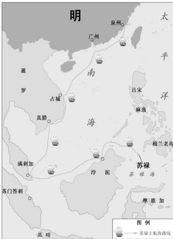
▲苏禄王来华路线图

首领巴都葛·叭答刺受到大明皇帝晓谕召唤的时候，面对长达三个月的漫长航线，以及夏季南中国海频发的台风威胁，没有丝毫犹豫就来华。