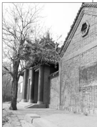
德州北营村