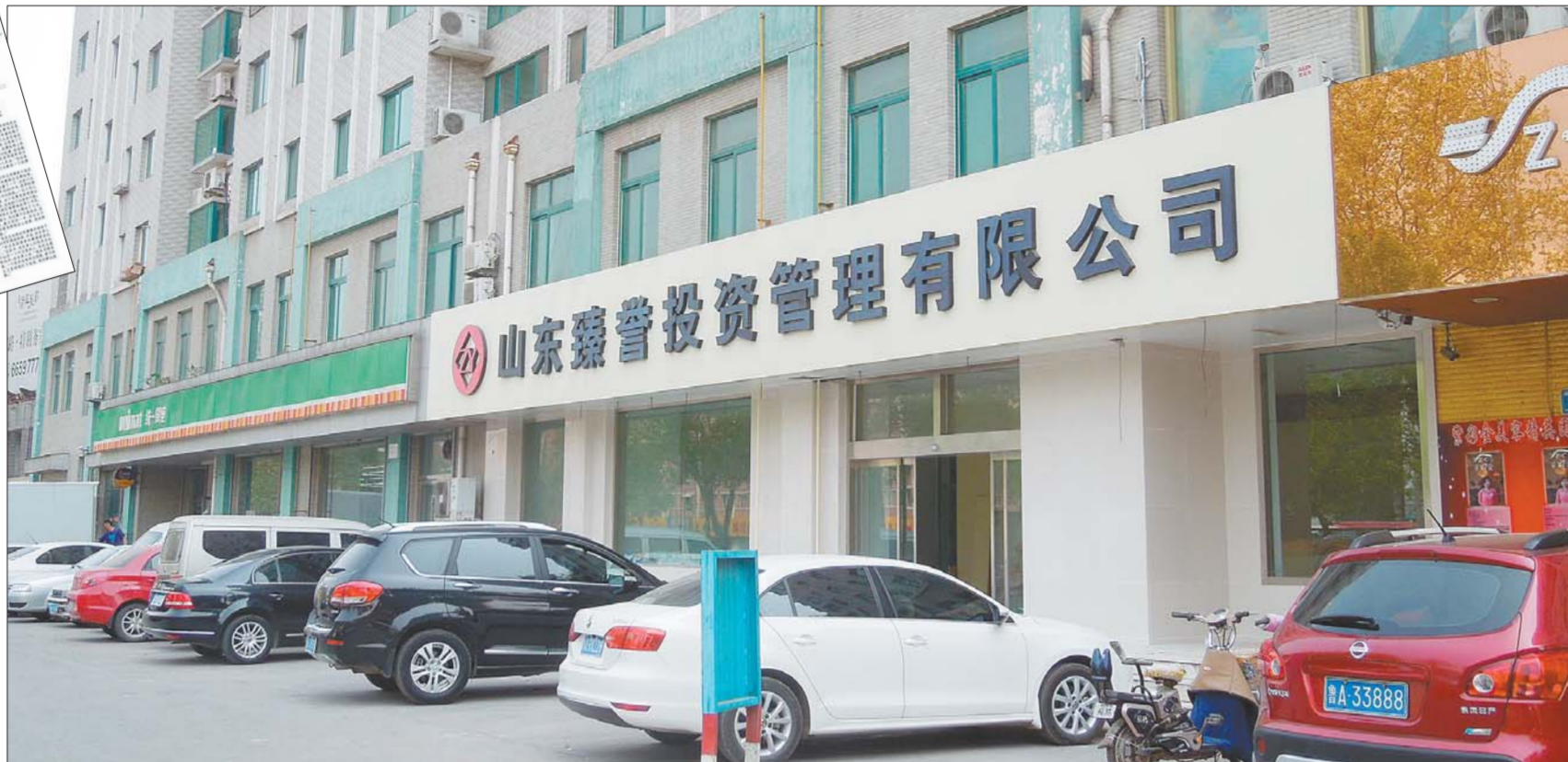
张先生装修的门头房,卫生费收取则算到了门前的马路中间。