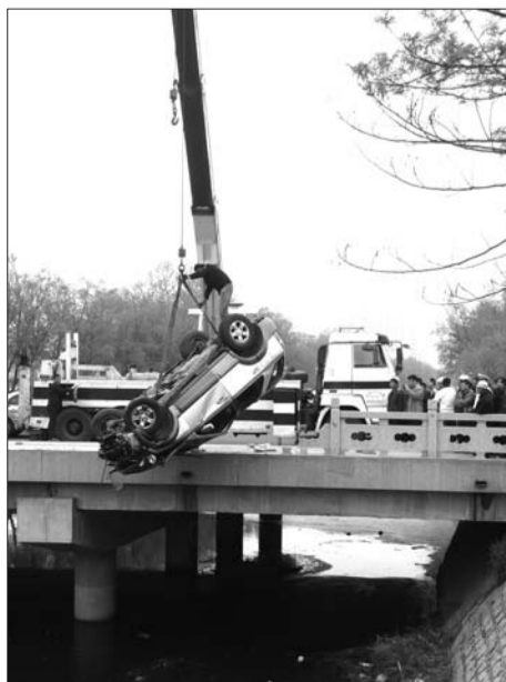
▲车辆“躺”在河水中,车中两人爬出翻越护栏迅速离开。