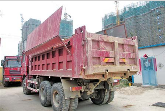
聊城市要求,所有渣土车要进行自动化封闭改造,否则不允许运营。

该人士称,虽然烟台空气质量比聊城好,但其改善幅度小,对全省空气质量改善的贡献小。而聊城虽然差,但改善幅度大,对全省空气质量改善的贡献大。要改善就要有措施,改善的多说明措施多,所以聊城拿钱多,烟台拿钱少。