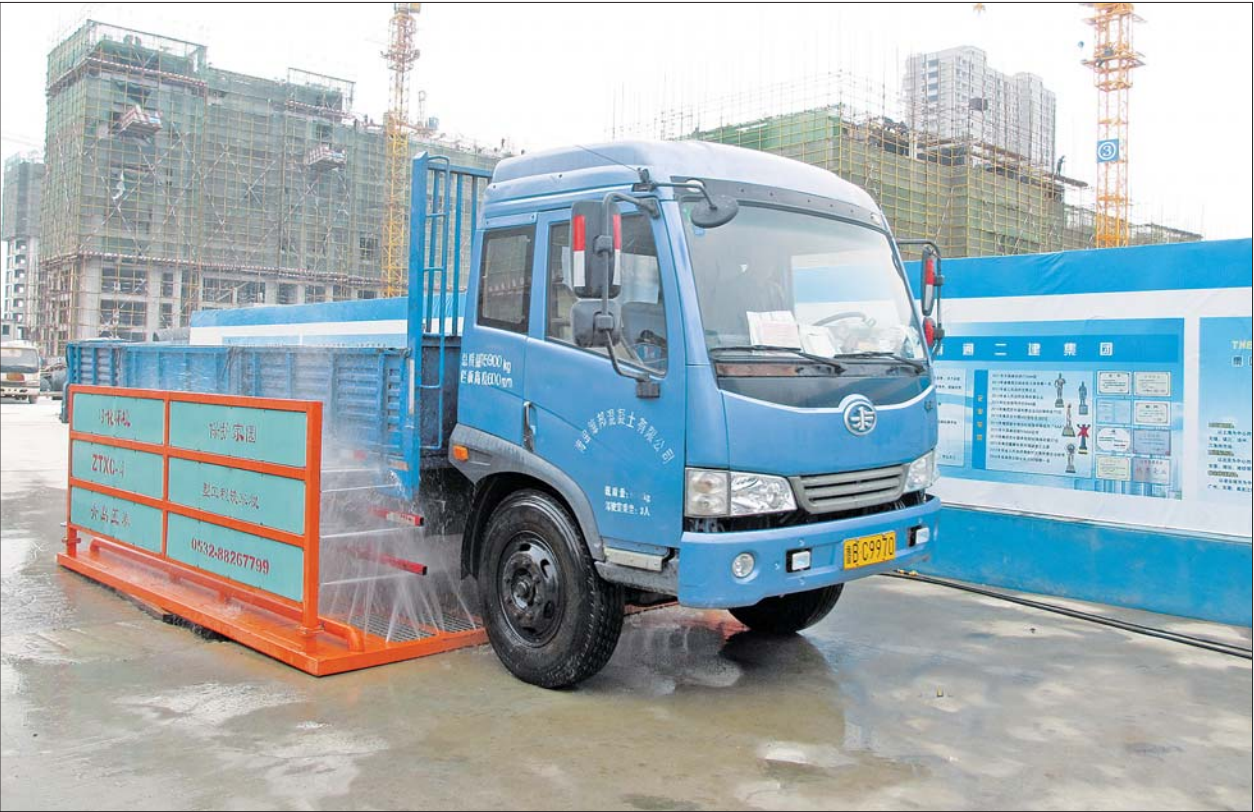
聊城市要求,进出工地的车辆必须经过冲洗,防止尘土带入工地之外的道路。