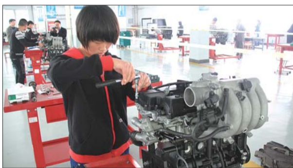
一名女生选择了与汽车相关的专业。

4月13日、14日,记者观摩了日照职业技术学院空乘专业单独招生考试,了解单独招生的优势。