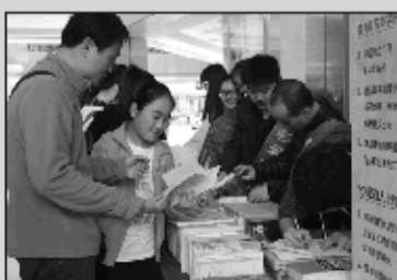
青岛福彩开展图书义卖活动

走访慰问群众、福彩扶老助行、帮扶困难群众等公益活动,资助乡镇小学建设图书室、肉乡村幼儿园捐赠玩具(设施)等。持续开展紧急救助活动,对91个特困家庭进行了救助。(陈静 王玉梅)