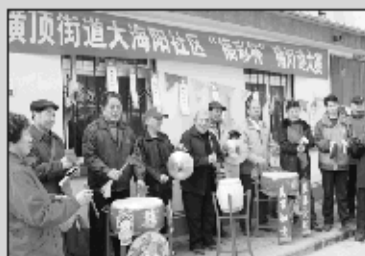
烟台福彩开展福彩文化进社区活动