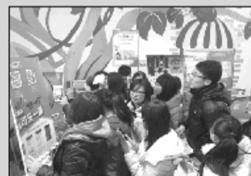
烟台福彩开展手机微信推广活动