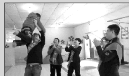
青岛福彩志愿者与自闭症儿童游戏互动