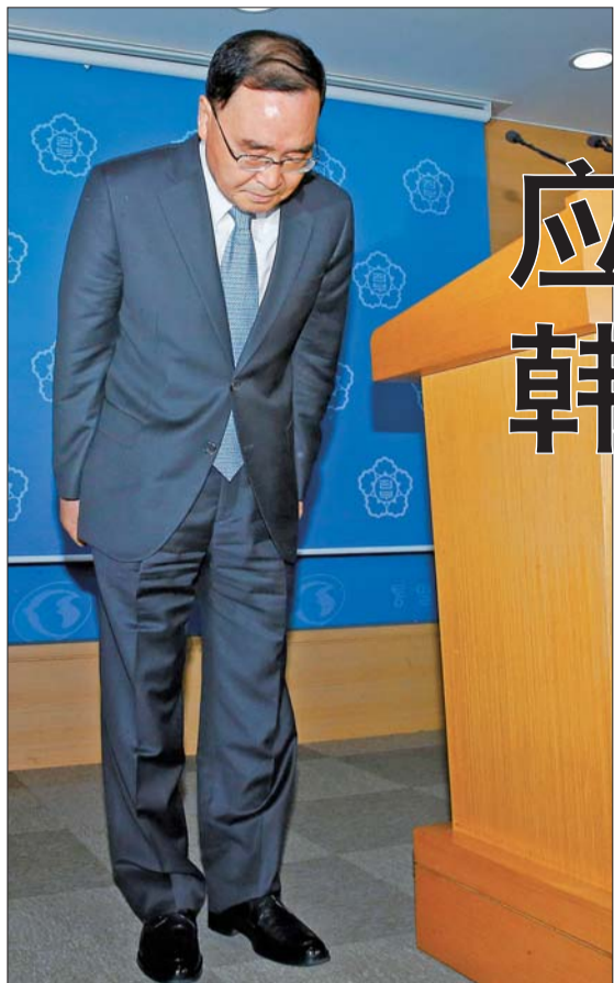
27日,在韩国首尔举行的记者会上,韩国总理郑烘原在宣布辞职后鞠躬。