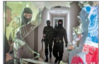
26日,在乌克兰东部城市马里乌波尔,亲俄武装人员在当地行政大楼里巡逻。

美国26日向立陶宛部署150名伞兵。为进行在波兰和波罗的海三国的军演,美国将向波兰、爱沙尼亚、拉脱维亚和立陶宛派遣600名美军。这些美国士兵预计将在该地区轮驻至年底。北约还表示,下月将派出三倍于先前数量的战机,巡逻波罗的海地区。 据新华社、人民网