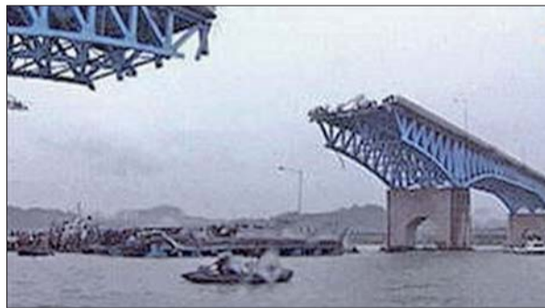
圣水大桥坍塌事故现场。(资料片)