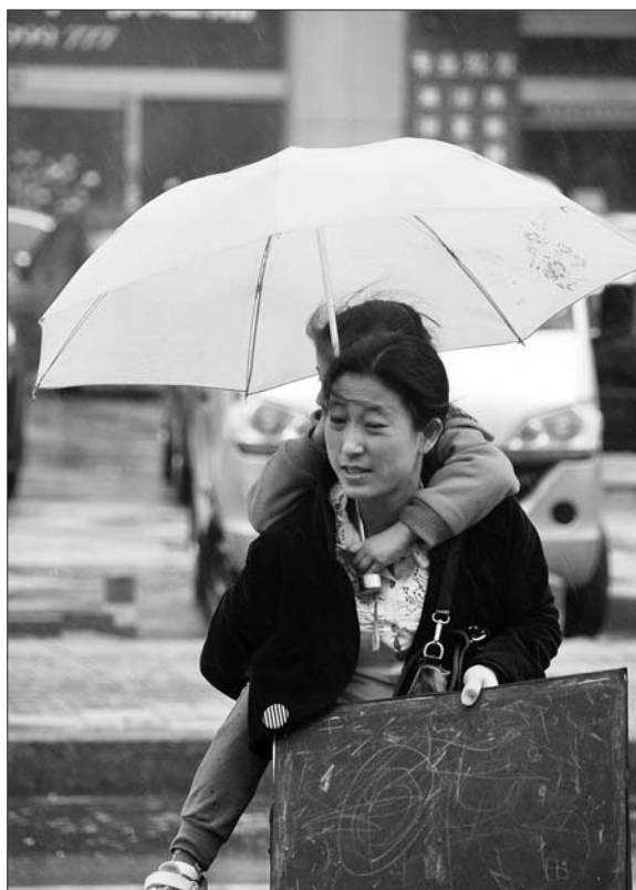
为了不让孩子淋雨,妈妈干脆背起孩子。

的天气预报显示,本次降雨过程预计28日上午结束,未来一周烟台天气以多云为主,下次降雨就得等劳动节假期之后了。 烟台市气象台27日20点发布暴雨蓝色预警信号。截至27日20点,烟台市大部分地区降水量已超过50毫米,预计未来降水将持续,为此烟台市气象台发布暴雨蓝色预警信号,提醒市民注意防范。