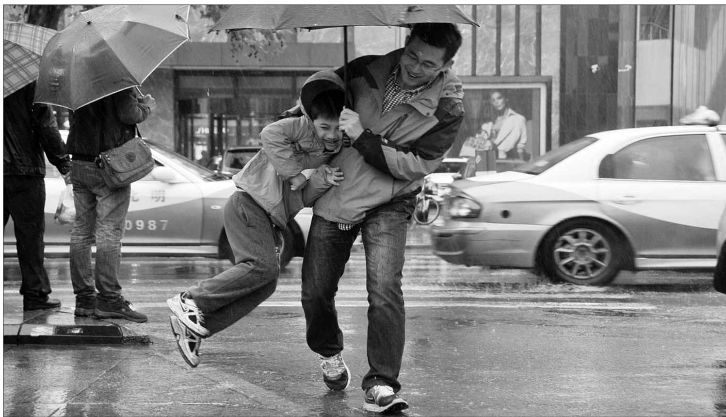
27日,久违的雨水终于来到港城,为了让孩子的鞋不沾水,一位家长抱着孩子从雨中通过。