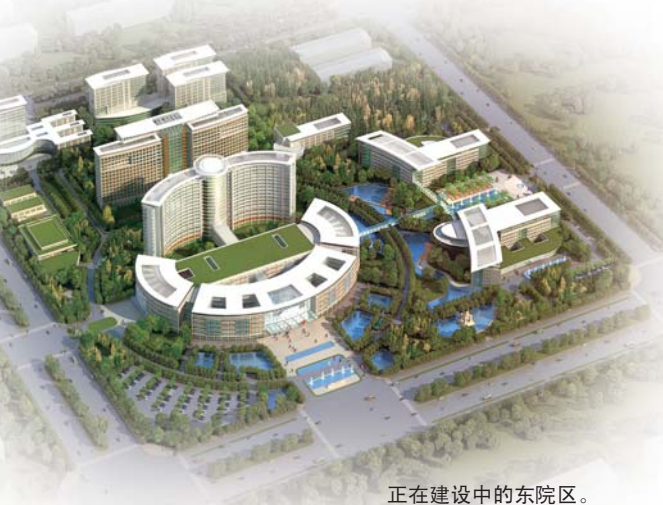
正在建设中的东院区。

首都医科大学生殖医学研究中心获博士学位。曾在国家卫生部人类辅助生殖技术培训基地—浙江大学附属妇产医院生殖中心培训ART临床及实验室技术,获得临床和实验室双岗位培训合格证书。熟练掌握女性生殖内分泌学临床专业知识,特别是超促排卵药物的使用