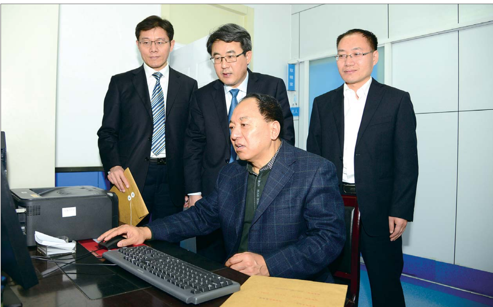
省卫计委领导专家来院进行试管婴儿专项检查。

具备实验室管理能力。熟练掌握人工授精、体外受精-胚胎移植、卵胞浆内单精子显微注射、精子冷冻、胚胎冷冻、卵母细胞染色体制备及分析等辅助生殖技术。近年发表SCI论文1篇,国家级核心期刊论文10余篇,著作3部,承担省级青年基金项目1项。