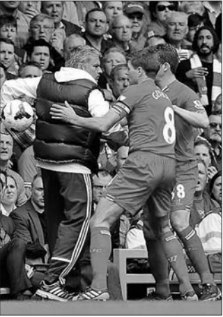
杰拉德:“把冠军给我!”穆里尼奥:“我就不给”——设计台词

而且在锁定欧冠席位后,罗杰斯可能会在夏季转会市场获得球队老板承诺的高达6000万英镑的转会费。赛季末,利物浦可能无法获得联赛冠军奖杯。下赛季的利物浦却让人充满着美好的期待,无论是在欧冠还是联赛,利物浦一定会给球迷带来许多惊喜。这样可爱的红军,再等一年又何妨?