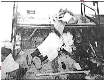
▼日寇虐杀中国三百多名伤病员(老照片)