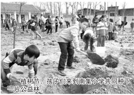
植树节，孩子们来到南集小学共同种下一片公益林。

好地服务小记者及小记者校园分团，提高广大学生的综合素质和能力，促进学生全面发展、特长发展，推进学校教育宣传工作，搭建学校和师生、家长之间的沟通平台。 自2011年小记者团成立以来，本报就专门开辟运河教育专版，积极搭建互动平台，目前开设的版块有“小记者”专题、“基础教育”专题，除此以外，还有以校园新闻为主的“信息速递”专题，积极做好分团学校的新闻、特色活动的宣传报道，体现为学生、学校服务的理念和目标，又增加了“教育连万家”专题，刊登学校教师的校园教育经验和家长家庭教育心得经验，积极搭建学校和家长的交流平台，促进学校、学生和家长的沟通。 未来，本报将一如既往的积极打造齐鲁晚报小记者团队，我们欢迎更多校园小记者分团加入，让更多孩子融入到这个大家庭里来，成为小记者团的一员，在这里结识更多的新朋友，参与各式精彩纷呈的活动，开拓视野，锻炼自我，将兴趣、乐趣与学习结合到一起。