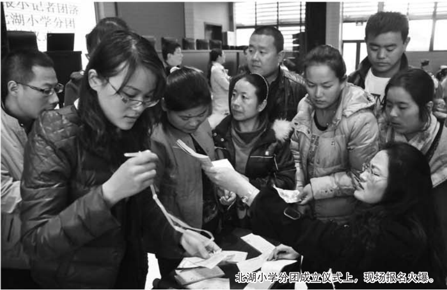
北湖小学分团成立仪式上，现场报名火爆。