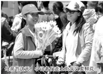
母亲节这天，小记者们走上街头义卖鲜花。