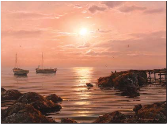
普列奥勃拉仁斯基的《平静》

名画欣赏:这幅作品的意境传递出一个“静”字。无论是颜色处理还是画中的道具,都给人一种安静、沉静之感。