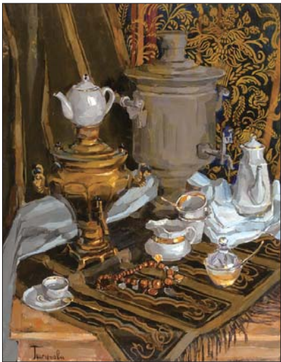
格里高利耶娃的《茶饮》

宝活动时间为5月11日上午。参与方式为加入鉴宝群373218662,从群文件中下载鉴宝报名表填写。收藏展及鉴宝活动地点为烟台开发区金桥澎湖湾会所(北京中路与黄金河路交汇处),咨询电话13963810179。