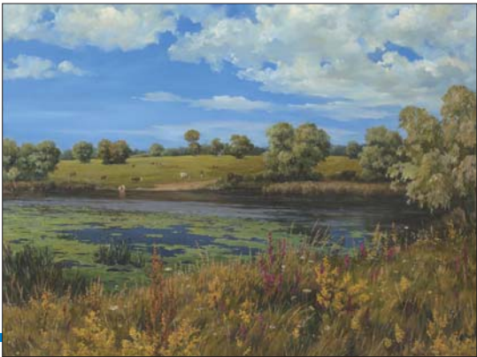
甘如加的《罗西河上》

名画欣赏:这是一幅有较强装饰性的作品,将装饰与写实、内容与形式巧妙地融为一体,把欣赏者引进一个与现实有距离的艺术境界中,却又要引起欣赏者对现实的联想,唤起美的享受。