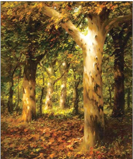
米杰金的《阳光下的悬铃木》

另外,俄罗斯油画的写实风格在肖像画上体现得淋漓尽致。肖像画,在画家与成功人士的激情碰撞中,激发成功人士的情感经验和审美经验,从而提高自身艺术鉴赏力,创造高尚的人生品位。这对弘扬创业精神和诚信为本的企业家品质起到了极大的推动作用。