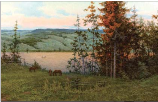
驿名的《在伏尔加河岸》

名画欣赏:这幅作品把今天的森林画得心情灿烂,不见了忧伤,忘记了不幸,没有了黑暗,方寸间的神韵,妙不可言!