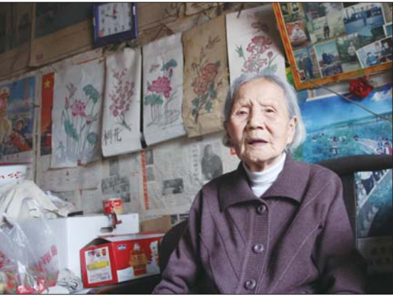
老人背后墙上挂着的便是她画的画。

来老太太家里贺寿的不只是自家儿女,四邻村民闻讯后,都带着水果、鸡蛋、牛奶等礼品来看她。老太太跟村民们聊起天来一直乐呵呵的,话里还带着几分幽默,时常引得别人哈哈大笑。