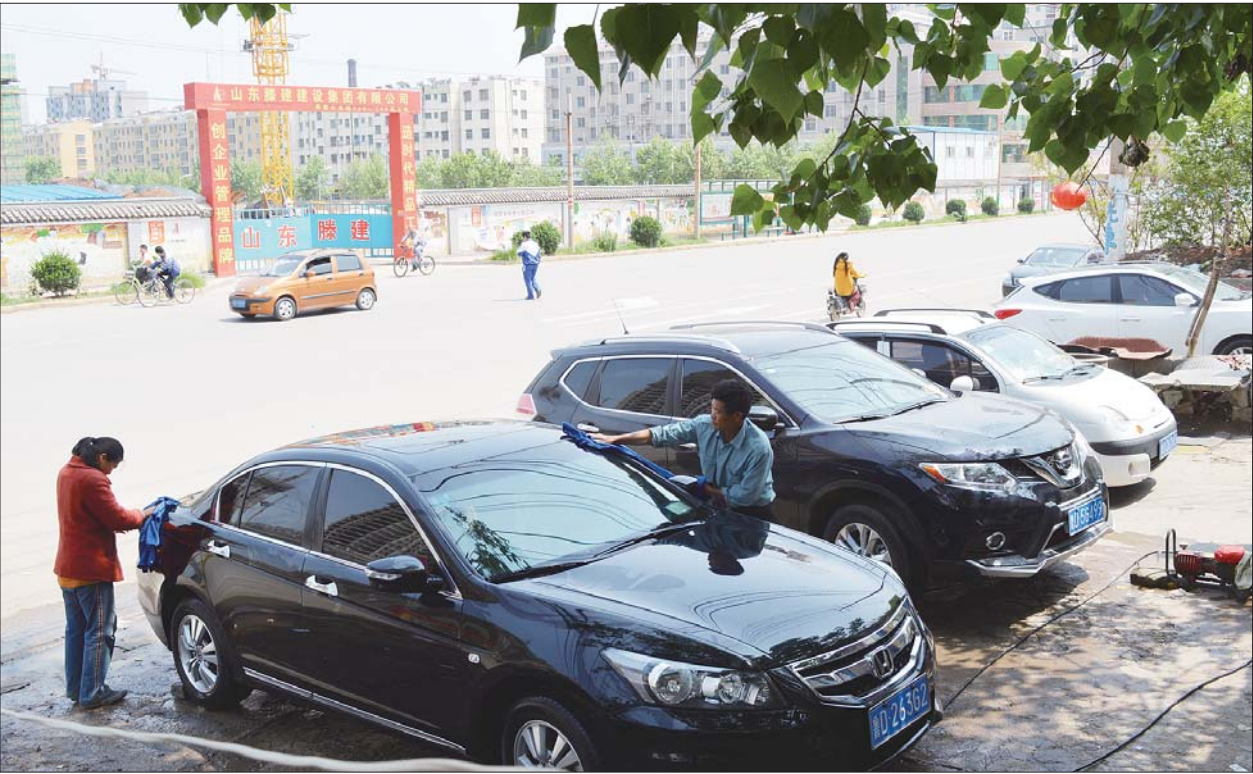
褚大爷说,最近几天生意特别好。 本报记者 贾晓雪 摄

25日,本报刊发了《一条微信引来爱心涌动》一文,稿子见报后引来爱心市民的关注。记者了解到,为了帮助困难的褚大爷一家,最近几天众多车主涌到褚大爷家的洗车店洗车,以这种方式向褚大爷伸出援助之手。