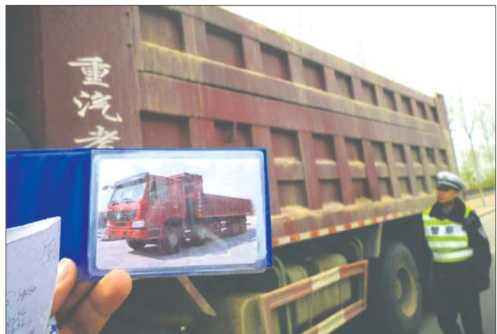
交警查获一辆私自加装车厢挡板的货车。(资料图)

记者从市交警二大队了解到,为了完成好这次集中注销活动,民警对车辆年检和驾驶员违法信息进行一一查询,经过核对后,如果没有交通违法行为以及其他问题,就办理注销手续。目前,113辆货车已全部注销。