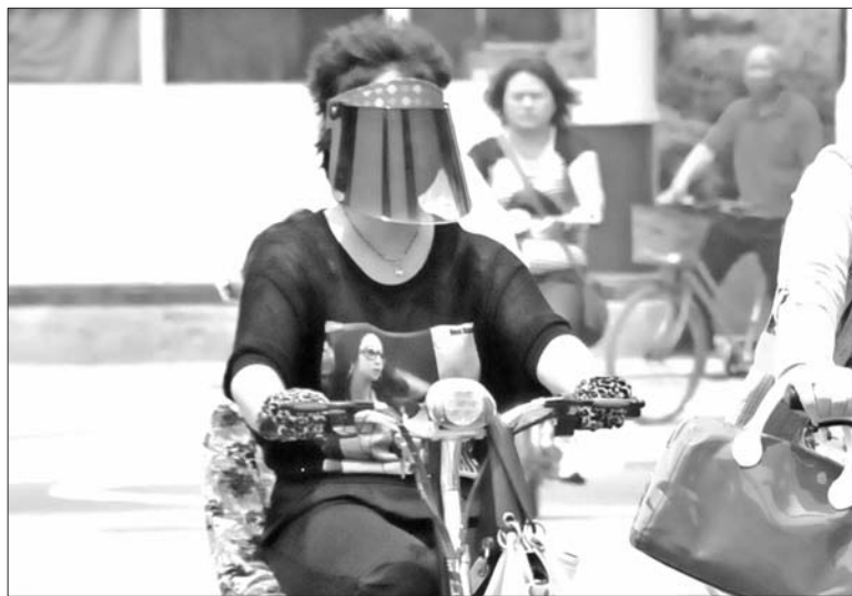
每到夏季,都有很多市民佩戴“面具式遮阳帽”。

5日立夏,各类防晒装备开始占据各大商场、精品店及地摊的重要位置,很多防晒产品成为市民的夏季防晒“标配”。为了躲避阳光的照射,一种俗称“面具式遮阳帽”的防晒帽成为许多骑车族尤其是女性消费者夏季防晒的“标配”。对此,眼科医生指出,这种用塑料制成的遮阳帽不仅不能遮阳,还会对眼睛造成损伤。