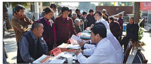
泰山区在大官庄村进行义诊。本报记者 侯峰 摄

本报泰安5月5日讯(记者 侯峰 通讯员 宋杨) 5日上午,泰山区在大官庄村开展健康义诊,两辆携带化验、X光等设备的健康查体车首次开进大官庄村,为120多名村民健康查体,免费发放连花清瘟胶囊等常用药品4万余元。