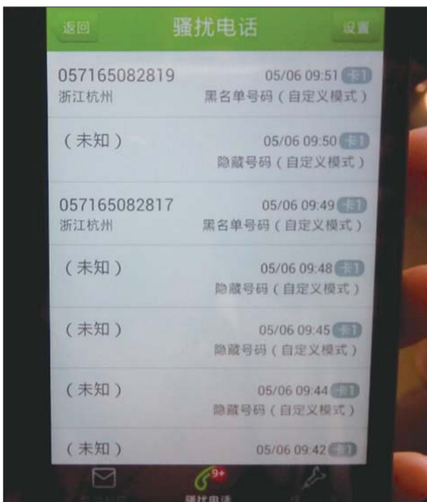
手机软件拦截的骚扰电话,不是未知号码就是空号。