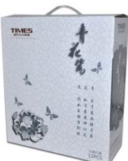
奖品:青花瓷碗勺套装,由时代1+1吊顶提供。