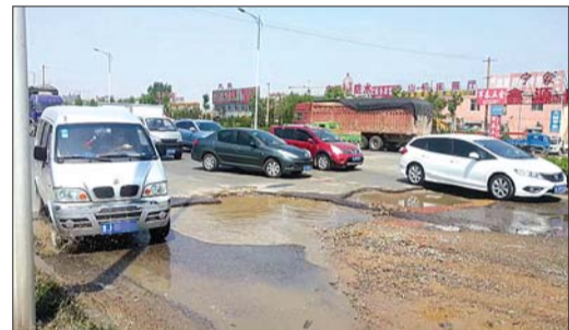
车辆纷纷躲着大坑走。

6日,记者拨打泰安市公共事业管理局的电话,工作人员了解情况后表示,会尽快通知相关部门进行处理。