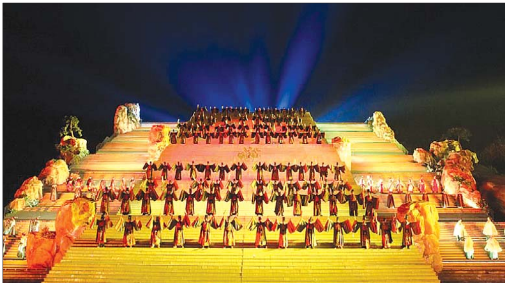
封禅大典等夜间项目，一定程度上弥补了泰安夜间旅游的空白。

根据部门数据显示，目前山东80%的收入、70%的人次来自于城区，城区旅游成为全省旅游的主要组成部分，发展城区游已经成为城区经济转型升级的迫切要求。经历过“泰山时代”和“山城时代”，泰安旅游目前正在向“旅游目的地”转变，发展城区游对泰安打造著名旅游目的地具有重要意义。