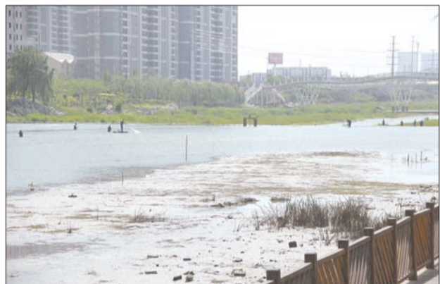
善国大桥西侧还未放完水的河段有市民在捕鱼。

本报枣庄5月6日讯(记者张冬梅 通讯员 李远健)5日起,陆续有市民向本报反映,发现荆河部分河段河水被排空,引来很多打鱼的人。突然排空河水,让市民很好奇,6日,记者从滕州市住建局了解到,排空河水是为了方便南线供热管网跨河道施工。