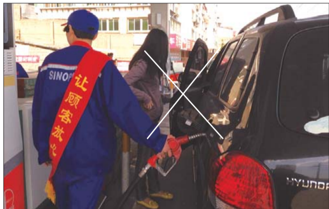
加油时开车门上车严重存在安全隐患