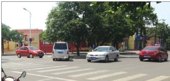
一辆面包车发现走错,正在倒车。

董先生认为,迎胜路上的左转弯箭头直接指向了柿子树的东侧,没有提醒要绕过柿子树。而且从这个路口看不到科山路上的标线。“应该增加一个环岛的路标,不然看不出要绕一圈。”董先生说。