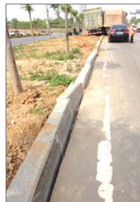
事故车辆撞坏路沿石。时躲避另一辆车。

包括司机在内的几名车上人员,正围着货车检查,想尽快将货车挪出。但因为满载沙子,大货车无法自行开出绿化带,司机找来另一辆货车,想通过倒走沙子的办法减轻重量把车开出绿化带。在出事货车的车门上标注有车辆准牵引40000千克字样。车上人员称,货车之所以会开进绿化带,是因为当