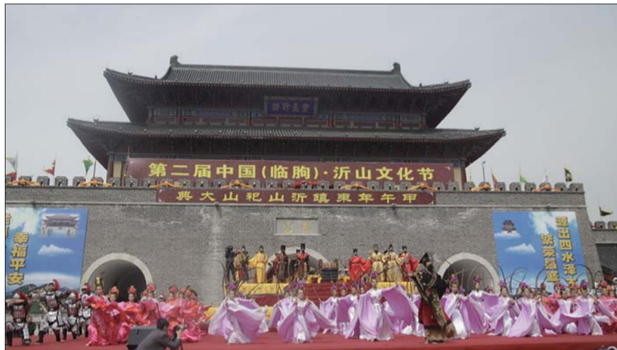
甲午年东镇沂山祀山大典正在举行。

古人对“五岳”“五镇”的崇拜由来已久,祀山文化源远流长。沂山为五镇之首,历代备受敬畏和尊崇,赠封连绵,祀典不废。甲午年东镇沂山祀山大典传承古代传统祀典礼仪,弘扬历史文化,融汇现代文明元素,真实再现了历代帝王祀山的恢宏场面,寄托了国泰民安的美好祝愿,让人们感受中国古代礼仪文化的的神奇魅力。