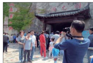
“五一”期间,博山区开元溶洞景区内游人如织。