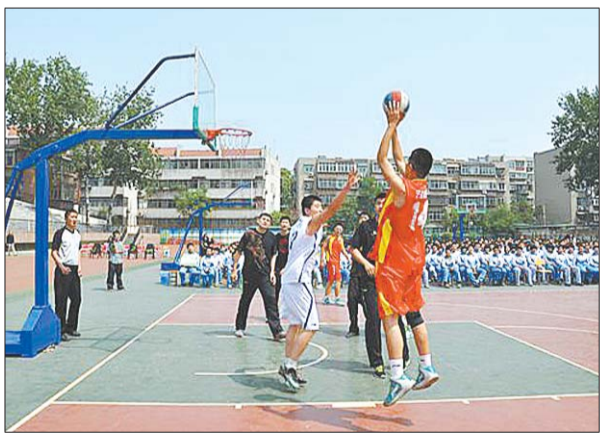
山东男篮与济南五中的小朋友交流。

全世界都在取笑希伯特,已经成为一种娱乐,希伯特这次状态回勇,也成为全民热议的话题。巧合的是,希伯特爆发的同时,拜纳姆因为伤病正式离开步行者队。希伯特的回归,将让步行者在攻防两端提升一个档次,现在步行者最关心的是,希伯特能不能不要这样时隐时现。