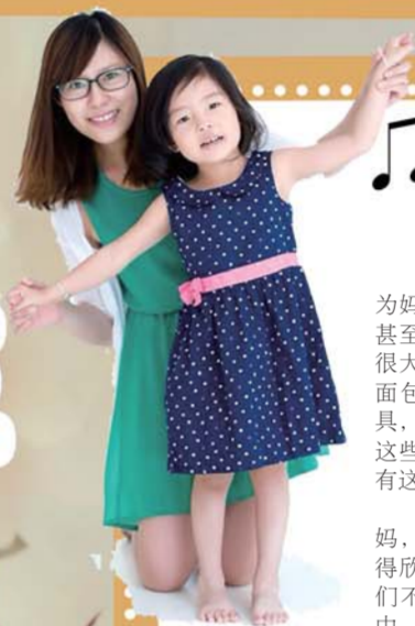
烘焙的意义妙不可言