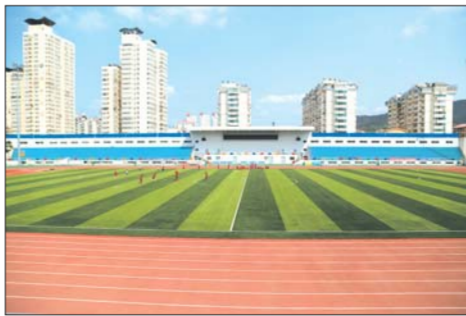
2013年改造升级后的芝罘区人民体育场。

其后，在烟台海阳进行的2013沙滩足球亚洲杯决赛中，中国沙滩足球男队以总比分4比3战胜阿联酋，历史性首次获得沙亚洲杯冠军。“这不仅是在烟台足球取得的成绩，更是烟台竞技体育发展的成果。”宋安立解释。