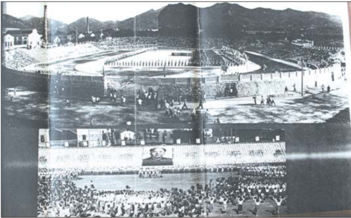
1973年，全国第一届中学运动会在烟台新建体育场(今西南河夜市)举办。