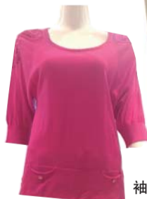
针织七分袖上衣238元