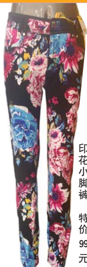
印花小脚褲 特价 99元