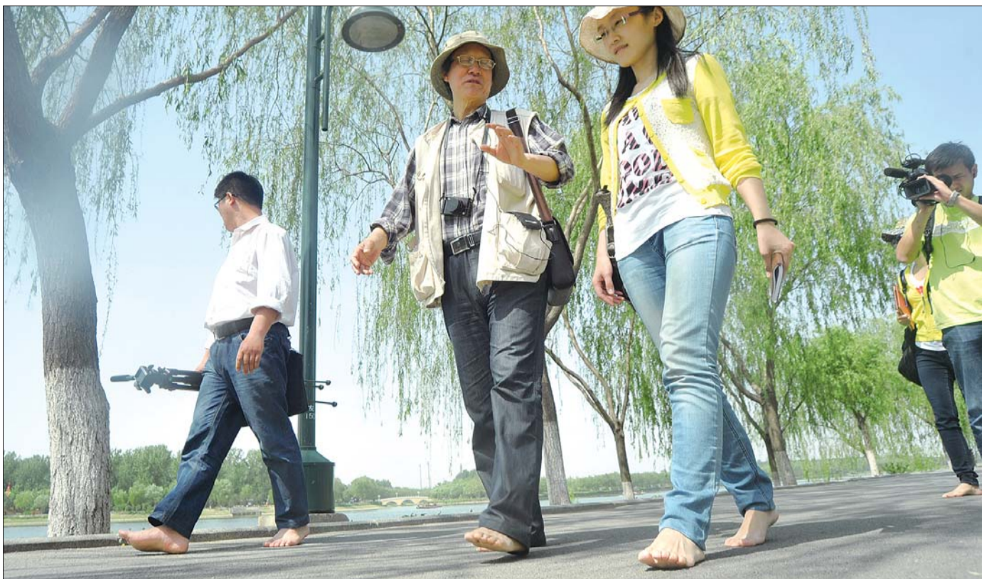
16日,考察队成员赤脚走在通州大运河森林公园内的“遗产小道”上,享受别样体验。