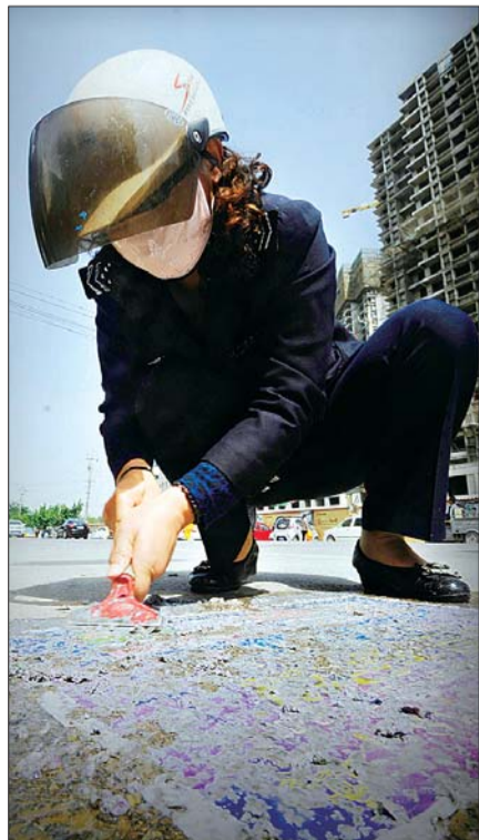
有些地面上的野广告更难清理。