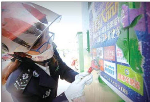
先喷水、再拿小铲子一点点地清除,清除这样一个广告要用四五分钟的时间。