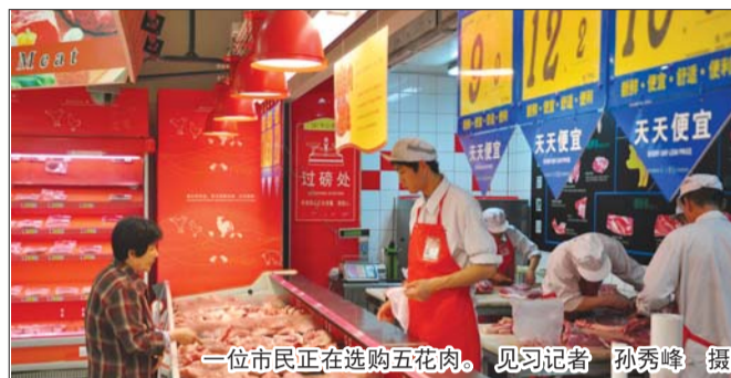
一位市民正在选购五花肉。

本报5月18日讯(记者 王领娣 见习记者 孙秀峰) 从2013年年底到2014年4月份中旬,猪肉价格一路走低,只降不升,一度跌至5元/斤,而从4月下旬开始,猪肉价格开始有了首次小幅上涨,截止至5月16日,毛猪价涨至7元/斤。