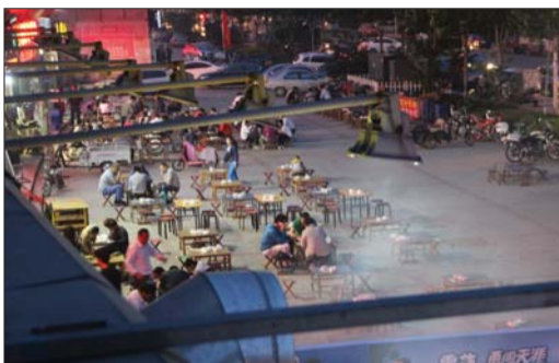
饭店油烟直扑民宅,场地上满是客人。

其实,像丽景花园向餐馆出租的小区沿街房有很多,因餐馆所产生的噪声、油烟或多或少会引起居民不满,到底小区沿街房能否向餐馆出租,记者采访了市城管执法局,他们表示目前滨州还没有出台相应法规,禁止餐饮业租赁小区沿街房。