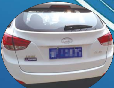
时尚感超强的背影