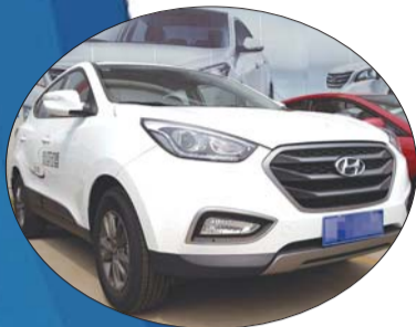
晶钻般的鹰眼大灯十分抢眼