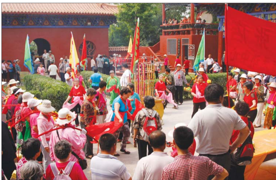
去年,无棣碣石山庙会人头攒动。(资料图)

据了解,本届碣石山庙会、千年古桑园文化节为期三天。23日,可在碣石山逛庙会,在古桑园听安徽黄梅戏选段、小戏;24日,在碣石山听完市吕剧团吕剧专场,再到古桑园内参加滨州市的象棋锦标赛,对战三回;25日,千年古桑园将举办“鲁北好声音”比赛,户外运动爱好者也可在饮马湖参加环湖自行车比赛。连续三天,精彩活动不断。