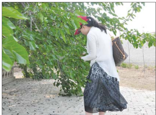
成熟的桑葚压低了桑树枝头,游客吃着桑葚,迟迟不走开。