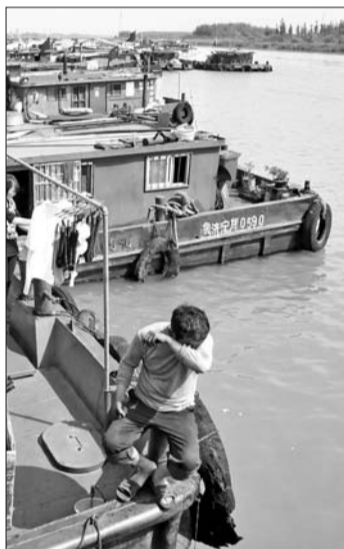
济宁以南运河航运仍非常繁忙。(资料片)

实际上，京杭大运河“折翼”后，济宁便成为整个北方运河航段中仅存的内河枢纽，这让曾经以贯通南北为骄傲的济宁感到孤独。