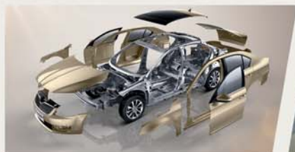
新一代MQB平台成就新巅峰！