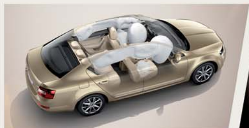
A+ 突破 无可匹敌的安全