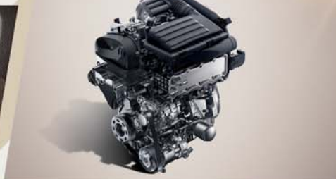
A+ 突破 完美高效的动力