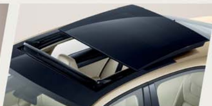
A+ 突破 简约时尚的设计