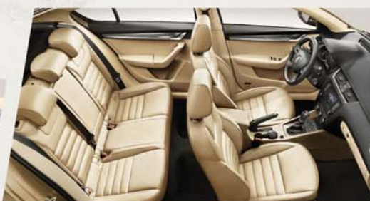
A+ 突破 不同凡响的享受