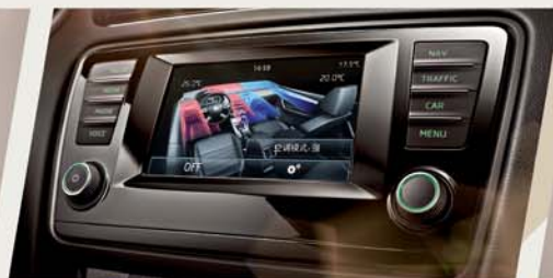
A+ 突破 接触未来的科技