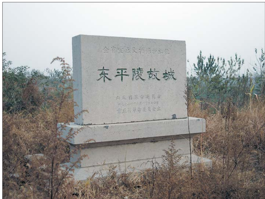
东平陵故城是全国文物保护单位。

汉灵帝中平元年(184年)，一代枭雄曹操曾担任济南国相，其治所就在东平陵故城。曹操出任济南国相时，正年富力强，到任伊始就大刀阔斧地整顿吏治，深受民众欢迎，而那些贪赃枉法、巧取豪夺之徒惊恐不已，惶惶不可终日，纷纷遁逃，“窜入他郡”。于是，“政教大行，一郡清平”。