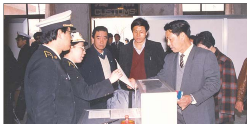
1990年，烟台到香港客运航线开通时，烟台海关工作人员在机场进行现场旅检。

随着越来越多的商品进口过来，烟台市民的消费生活也得到了很大的改变，可以触手可及地享用世界各地的产品。2013年，韩国是烟台最大的进口国，美国是烟台最大的出口国。