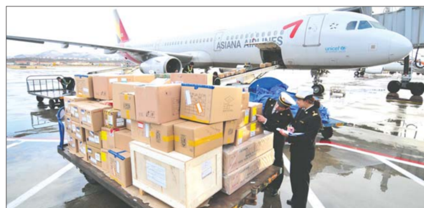
2011年11月，海关关员对货运包机出口货物进行现场监管。

对外贸易亦称“国际贸易”或“进出口贸易”，简称“外贸”，是指一个国家(地区)与另一个国家(地区)之间的商品、劳务和技术的交换活动。这种贸易由进口和出口两个部分组成。