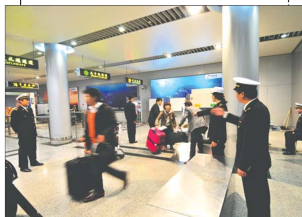
2012年，在烟台机场，现场旅检通关已经变得非常快捷。

烟台还举办了国际葡萄酒节、东亚城市进出口商品交易会、APEC贸易投资博览会、国际果蔬博览会等贸易促进活动。通过多形式、全方位对外开拓，逐步建立起了比较系统的对外销售网络，形成了多元化的市场格局，外贸出口持续大幅度增长，经营规模日益发展壮大。