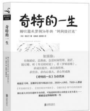
《奇特的一生——柳比歇夫坚持56年的“时间统计法”》 作者:格拉宁 译者:侯焕阁、唐其慈 出版社:北京联合出版公司 出版时间:2013年6月

本书是根据作者自己1998年起在阿富汗及伊拉克的采访观察写成,作者舍去了政治局势分析与褒贬功过,而是专注于还原战争中的一个“人”,从士兵到平民,从高层军官到普通老百姓,他们在战争中的切身感受,所思所想,他们的生存处境。全书充满了众多真切而生动的感人细节。