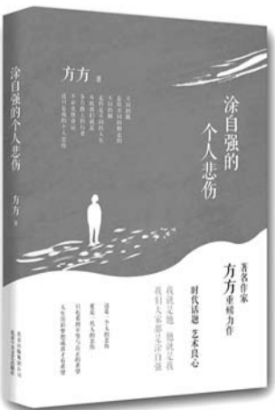
《涂自强的个人悲伤》 作者:方方 出版社:北京十月文艺出版社 出版时间:2013年5月

主题,还是艺术特色,《涂自强的个人悲伤》都是极其重要的文学文本。小说最后,涂自强留给人世最后遗言是:“这只是我的个人悲伤。”可是,作家带领我们思考:“果然就只是你的个人悲伤么?”一方面,涂自强是自强不息的,顽强地对抗命运;另一方面,他的自强又是徒然的(“徒”自强)。小说同时表达出同情和悲叹两种不同的情绪,复杂地描述当代中国现实的同时发人深思。