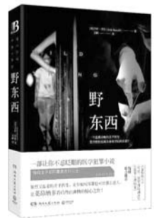
野东西 作者:(美)乔许·贝佐 出版社:湖南文艺出版社 译者:郑铮

两年前发生于明尼苏达州白湖的一桩命案引起了各方的关注。与此同时,布朗医师卷入一场旋涡,很快便身不由己。但布朗医师凭着一贯的冷静和敏锐周旋于一队军队的帮凶、一群暴徒和国际贩毒组织之间,并逐步揭开了白湖杀手的真实面目!