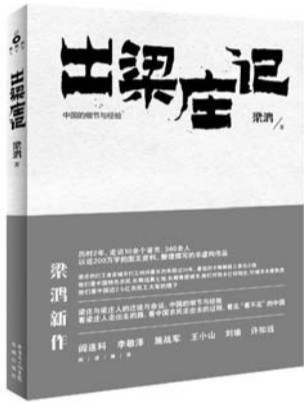
《出梁庄记》 作者:梁鸿 出版社:花城出版社 出版时间:2013年3月

幸福、新生活和现代的理解力也越来越一元化。实际上,在这一思维观念下,‘农民工’非但没有成为市民,没有接受到公民教育,反而更加‘农民化’。”作者的视角和发现不可谓不令人深省。学院出身的梁鸿能有如此阔达的视野和深湛的理解,不能不说是奇迹,可以作为当今知识分子仍然保有思考能力的例证。同样,作为非虚构作品,梁鸿的两部书将会在时间长河中占有越来越重要的地位。