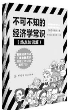
不可不知的经济学常识·热点知识篇 作者:(韩)郑载学 著 译者:林今淑、崔文哲 出版社:中国纺织出版社

本书是加措活佛首部作品,也是他首度公开分享生命沉淀的轨迹与感悟。以人生、情感、信念、生活、爱、快乐、幸福、智慧、情绪为主题,教我们如何对待生命中的困惑与迷茫,增强面对世事无常的内在力量。