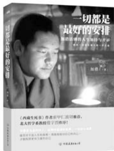
一切都是最好的安排 作者:加措 出版社:中国友谊出版公司

本书是加措活佛首部作品,也是他首度公开分享生命沉淀的轨迹与感悟。以人生、情感、信念、生活、爱、快乐、幸福、智慧、情绪为主题,教我们如何对待生命中的困惑与迷茫,增强面对世事无常的内在力量。