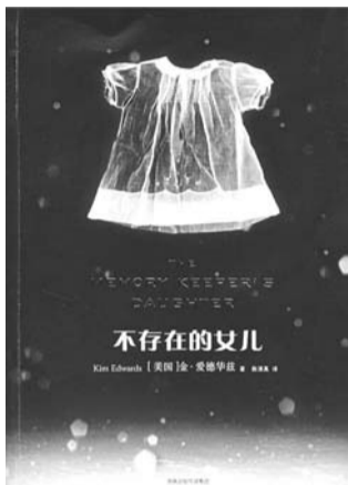
《不存在的女儿》 作者:金·爱德华兹 译者:施清真 出版社:译林出版社 出版时间:2007年8月

小说没有跌宕起伏的情节,没有激烈的矛盾冲突,只有忧伤深远、娓娓道来的从容叙事,却充满了张力,将人性的深度和无处不在的心灵孤独揭示得淋漓尽致。小说抓住家庭伦理这个最能打动人心的结构,叙写了现代人的精神困境和生存艰难。2005年,这部小说使得作者一夜成名,感动了全世界的读者,最重要的原因就在于其中的人性力量和作者对人性的深刻理解。